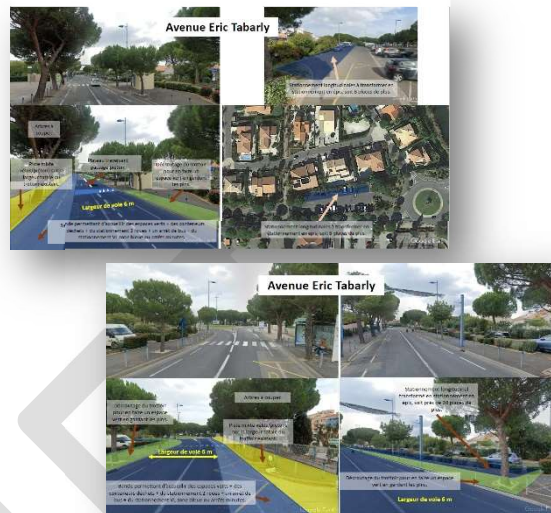
Figure 3: contribution reçue par mail