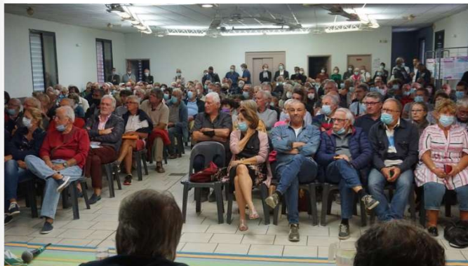
Figure : réunion publique organisée le 15 octobre 2021