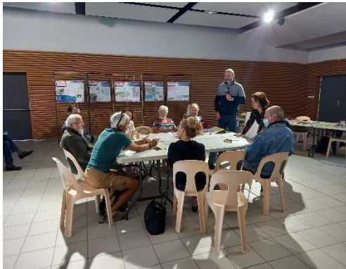
Atelier "Espaces publics régénérés et recomposés"