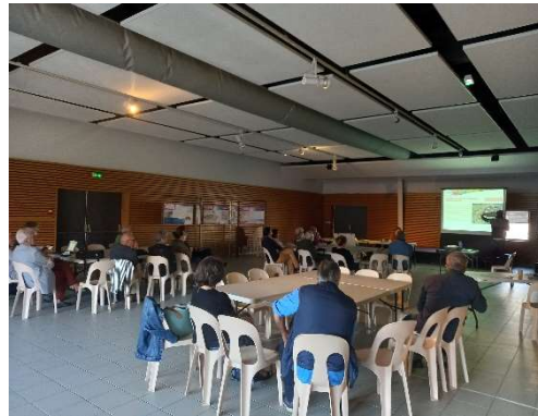
Atelier "Mobilités & accessibilité au Port et son quartier"